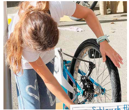
Auf Hochglanz gebracht